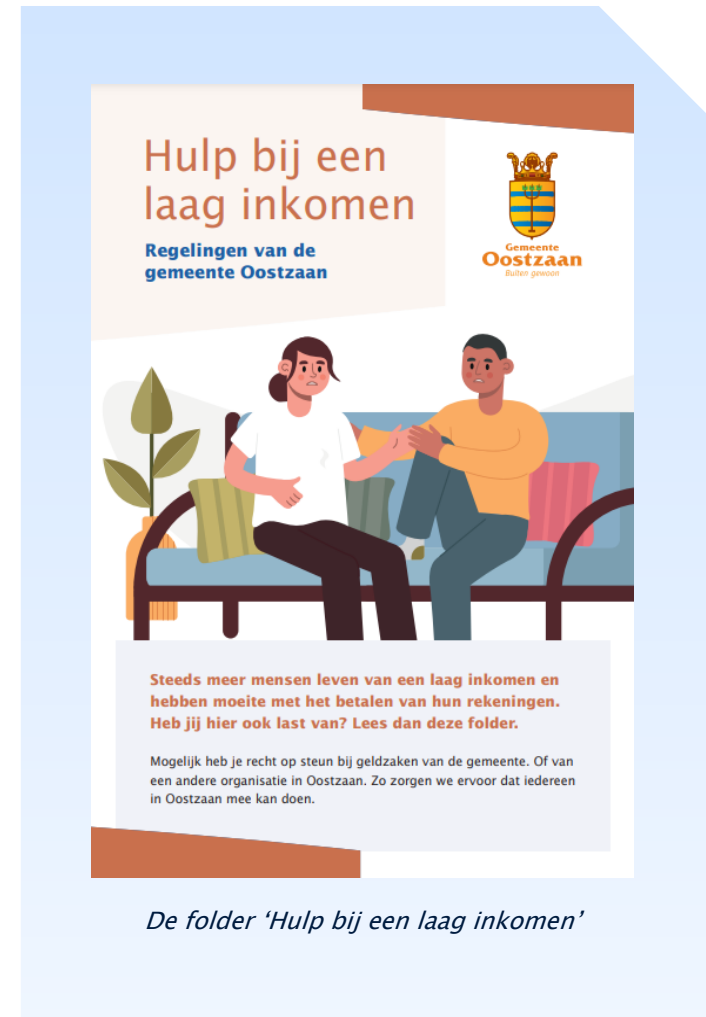
De folder 'Hulp bij een laag inkomen'

De afgelopen jaren vonden we het belangrijk om niet alleen een plan te maken, maar ook al actie te ondernemen om energiarmede en de gevolgen van inflatie te verminderen. Zo is de energietoeslag uitgekeerd en zijn er punten ingericht waar inwoners gratis menstruatieproducten kunnen krijgen. We wilden ook beter laten zien welke hulp er is en hoe inwoners die kunnen krijgen. Daarom hebben we een folder gemaakt met een overzicht van alle regelingen in Oostzaan. Deze folder hebben we verspreid onder verschillende partners en is ook gestuurd naar alle huishoudens die in 2024 de energietoeslag hebben ontvangen.