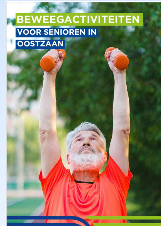
Het boekje van Team Sportservice