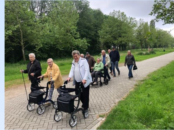
Gezellig samen wandelen in het Twiske

Ouderen horen over het rollatorwandelen via vrienden en familie. Maar ook huisartsen moedigen hen aan om mee te doen. Het gaat bijvoorbeeld om ouderen die niet veel meer bewegen en/of weinig sociale contacten hebben. Voor iedereen die twijfelt, heeft Rob een duidelijke boodschap: "De rollator helpt je om mee te blijven doen. Je conditie verbetert en door de gezellige contacten word je ook nog eens een vrolijker mens!"